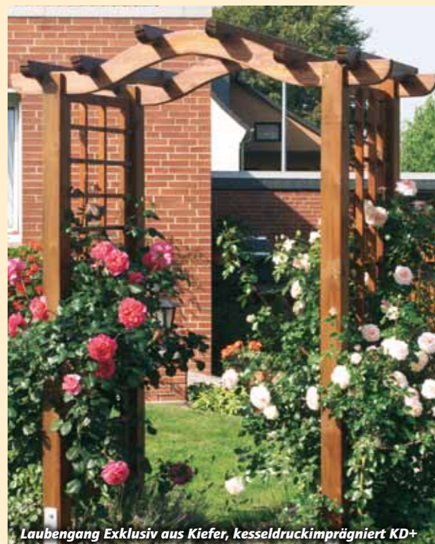
Laubengang Exklusiv aus Kiefer, kesseldruckimprägniert KD+