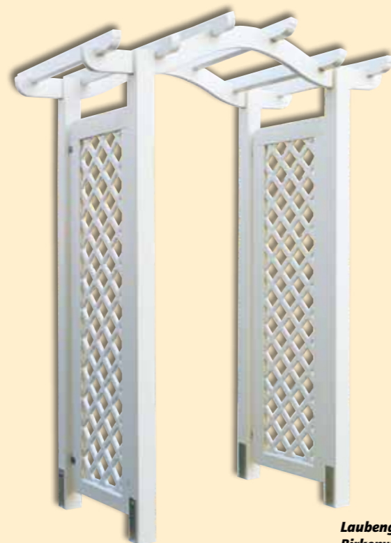
Laubengang Exklusiv aus Douglasie Birkenweiß Color