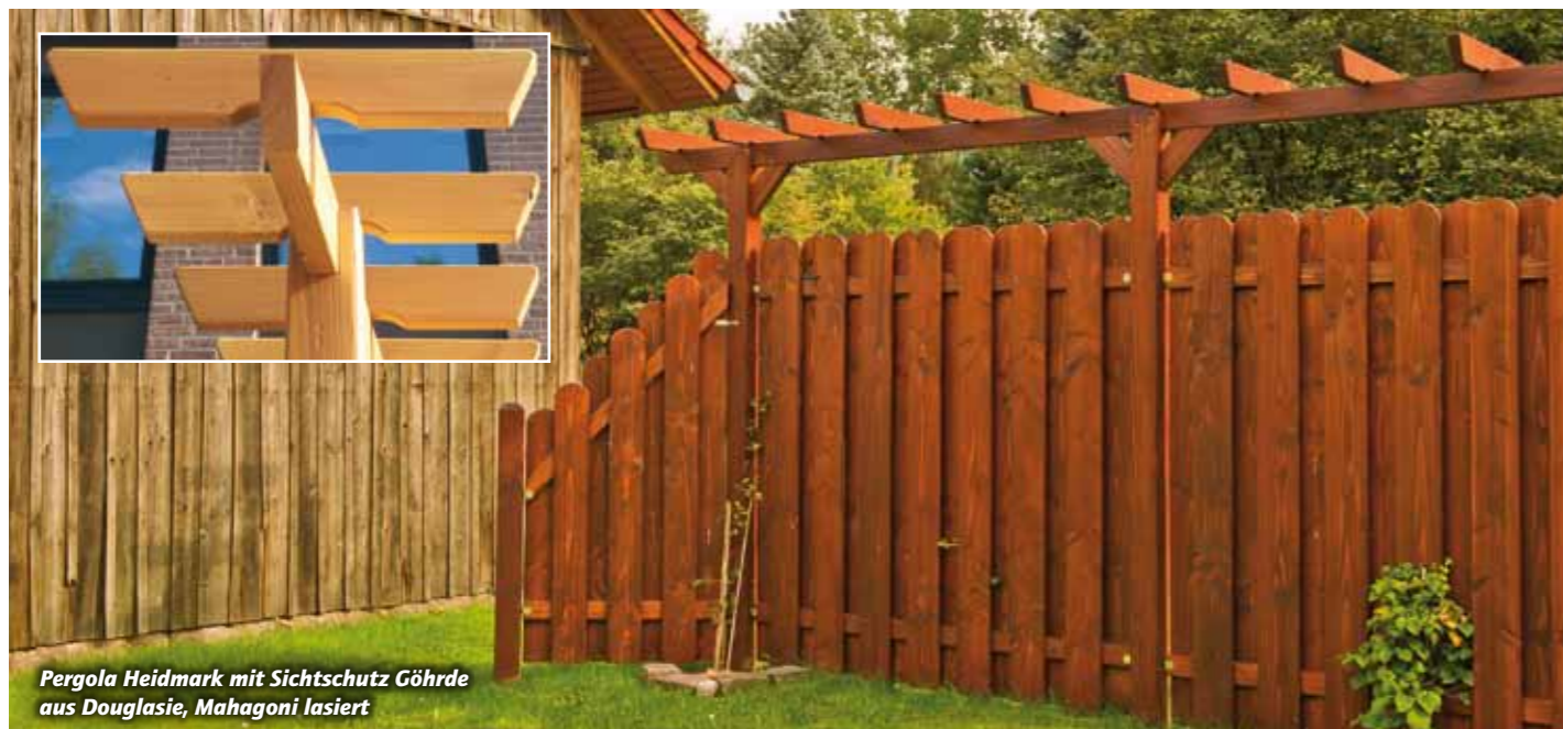
Pergola Heidmark mit Sichtschutz Gohrde aus Douglasie, Mahagoni lasiert

Die spielerische Variante. Pfosten 9 x 9 cm mit einer Ausklinkung 4 x 10 cm, in die der Holm 4 x 10 cm gelegt wird. Auflagen 4 x 9 cm. Das Material ist wahlweise Kiefer kesseldruckimprägniert oder Douglasie unbehandelt bzw. farbbehandelt. Es gibt komplette Pergolenbausätze oder Sie stellen sich aus Einzelmaterial Ihre Pergola im Baukastensystem zusammen. Für Fundamentmontage, ohne Anker.