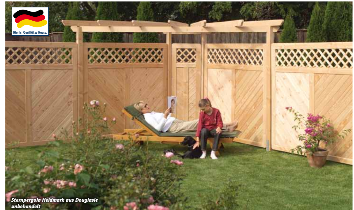
Sternpergola Heidmark aus Douglasie unbehandelt